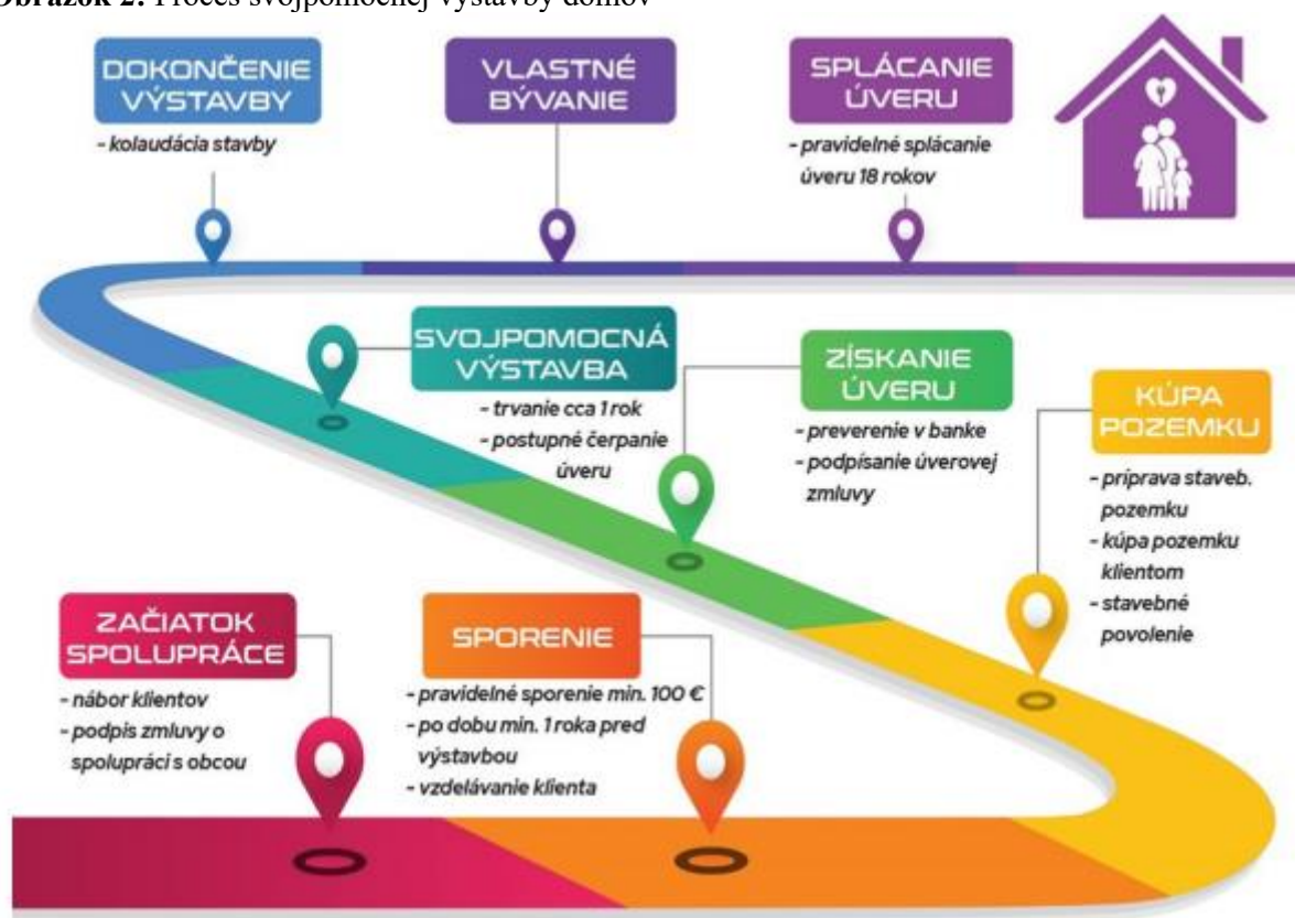
Obrázok 2: Proces svojpomocnej výstavby domov